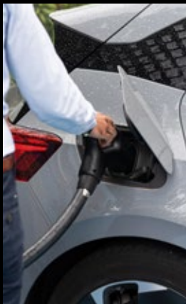
2. Branchez votre voiture à un chargeur disponible.