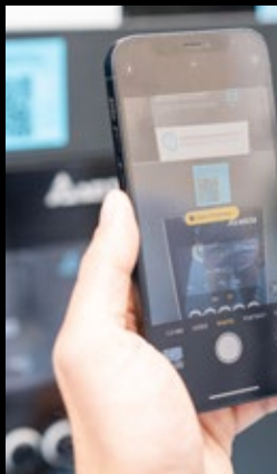
3. Scannez le QR code bleu affiché sur le chargeur.