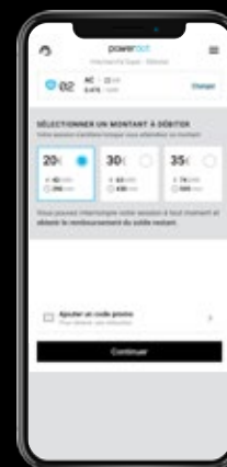
5. Sélectionnez un montant à débiter puis ajoutez le code promo "AON25".